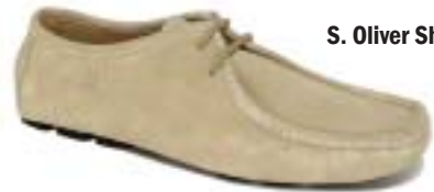
S. Oliver Shoes