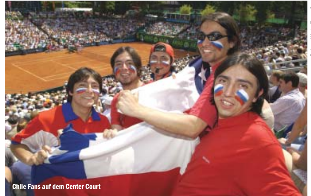
Chile Fans auf dem Center Court

Und das gibt es nur einmal in Deutschland: bereits am ersten Wettkampftag, Pfingstsonntag, 15. Mai, spielen die Topstars beim ARAG WORLD TEAM CUP gegeneinander. Der einzigartige Modus macht's möglich. Auf beiden