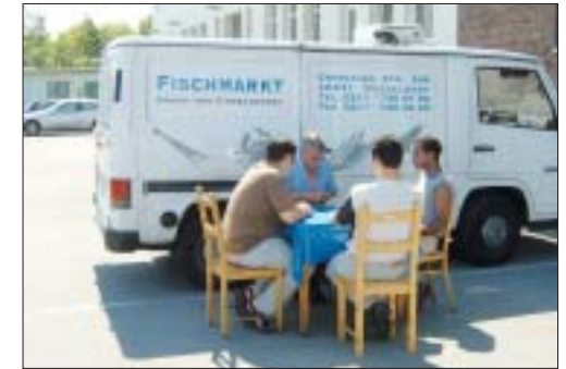
Fischmärkte - Kulinarischer Tipp

den lebendigen Einzelhandel der Stadtkerne massiv bedrohen. Ein Schritt in die richtige Richtung ist der seit gut zwei Jahren bestehende Wochenmarkt am Hermannplatz. Jeden Samstag von 08:00 bis 13:00 Uhr werden unter anderem frische Fleisch- und Wurstwaren, Obst und Gemüse, Blumen und frische Backwaren angeboten.