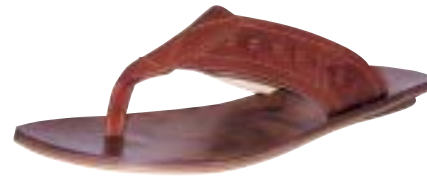
ITKIB Shoes & Leather

Der Sneaker - mit Streifen, Logos und Emblemen, ihm werden hier keine Grenzen gesetzt. Doch die Konkurrenz naht - neue Bootsschuhe, Mokassins, der legendäre Chuck und Sandalen sind mit von der Partie.