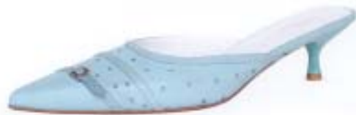
S. Oliver Shoes