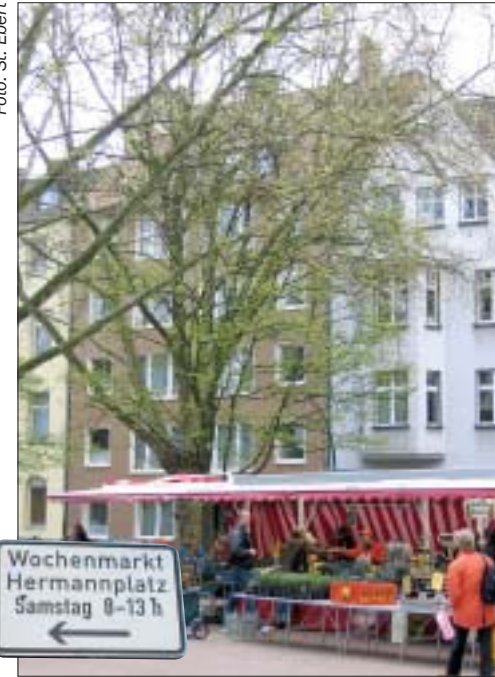
Wochenmarkt am Hermannplatz - Jeden Samstag