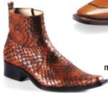
ITKIB Shoes & Leather