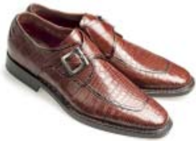
Noble Blue, van Bommel

Extravaganter Luxus meets Latino Chic - so sieht dieser Trend bei den Herren aus. Glanz bei Stoffen und Leder. Die Formen der Schuhe basieren auf bewährten Klassikern.