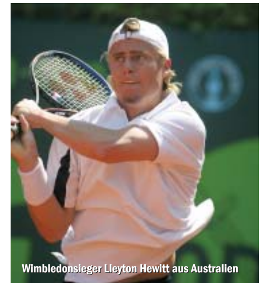
Wimbledonsieger Lleyton Hewitt aus Australien

Tickets zum ARAG WORLD TEAM CUP können per Telefon unter der Nummer 0211-9596444 erworben werden, aber auch online über die Internetseite www.arag-world-team-cup.com . Dort gibt es außerdem viele weitere, nützliche Informationen rund um die Weltmeisterschaft.