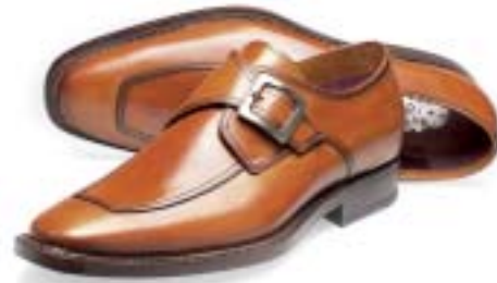
Noble Blue, van Bommel