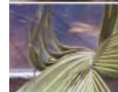
Steve Mc Queen - Carib's Leap / Western Deep, 2002