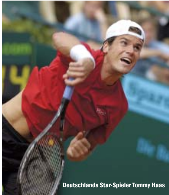
Deutschlands Star-Spieler Tommy Haas

Spannung und Weltklasse vom ersten Tag an