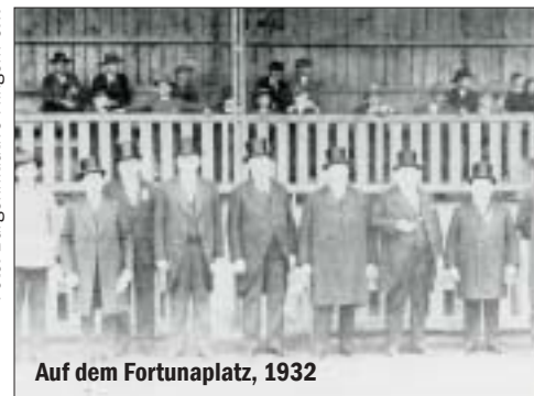
Auf dem Fortunaplatz, 1932

sich einig, "das ist unser Name, Fortuna!" Im Jahr 1930 stellte die Stadt der Fortuna im Flinger Broich ein Stück Sumpfland zur Verfügung, aus dem die Fußballer einen Rasenplatz machten. Zuvor wurde auf dem Alemanniaplatz gespielt. 1933 erlebte die Mannschaft dann einen ersten Höhepunkt, als die Deutsche Meisterschaft errungen wurde. Nach der Zäsur des Krieges wurde in Flingern gleich wieder Fußball gespielt. Erster Gegner der Fortuna: die Viktoria aus Oberbilk. Damals ging es aber weniger um Siege und Punkte. Gespielt wurde für Kartoffeln, Speck und Zuckerrüben. Lebensmittel waren äußerst knapp. Als dann wieder ein geordneter Spielbetrieb möglich und der Vertragsfußball eingeführt war, ging's aufwärts für die Fortunen, die in diesen Jahren von ihrem Ex-Star Paul Janes trainiert wurden. Der ganz große Erfolg blieb jedoch aus. Im Sommer 1972 kam es zum Umzug in das für die WM 1974 umgebaute Rheinstadion. Im ersten Jahr im neuen Stadion gelang ihnen mit dem dritten Platz eine der besten Bundesligaplatzierungen der Vereinsgeschichte. Im Flinger Broich wurden nur noch vereinzelt Freundschafts- oder Pokalspiele ausgetragen. Was bis weit in die neunziger Jahre hinein für kaum möglich gehalten wurde, trat in der zweiten Saisonhälfte 2001/2002 ein. Fortuna kehrte in das renovierte Paul Janes Stadion zurück.