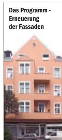
Das Programm - Erneuerung der Fassaden

staltet. Zusammen mit der Künstlergruppe „Farbfieber“ bemalten Nachbarn und Kinder die Grenzmauer zum Höherweg. Die Eröffnung wurde im September 2004 gemeinsam mit dem 10jährigen Bestehen der Jugendeinrichtung gefeiert. - Zwei Schulhöfe erhielten neue Kletter- und Spieltürme, großzügige Entsiegelung und neue Pflanzen. - Das Außengelände des Spielhauses Dorotheenstraße ist nach Wünschen und durch Hilfe der Kinder und deren Eltern zu einem beliebten Spielhof mit viel Grün umgestaltet worden. - Der Spielplatz im Innenhof an der Flurstraße 32 bietet eine ruhige Oase und viele Spielmöglichkeiten für die jüngeren Kinder - Das Programm zur Erneuerung der Hausfassaden wurde von den Hausbesitzern weiterhin