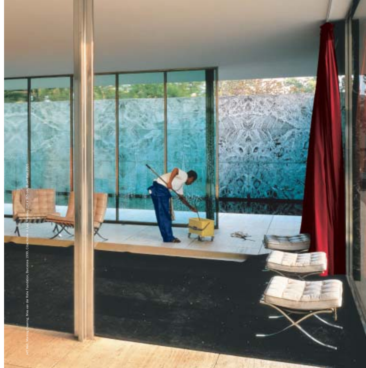
Jeff Wall, Morning Cleaning, Mies van der Rohe Foundation, Barcelona 1999, Glasfront in Leinwand, 204 x 365 cm, © Jeff Wall 2005