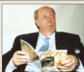
Reiner Calmund und Ciao

Im Capitol Düsseldorf feierten am 14. März mehr als 700 Gäste die Verleihung des MarkenAward 2005. Henkel, der Mobilfunkanbieter O2 und DWS Investments gingen als strahlende Sieger hervor. Unter den Gästen, Reiner Calmund , der interessiert in der letzten Ciao Ausgabe blätterte.