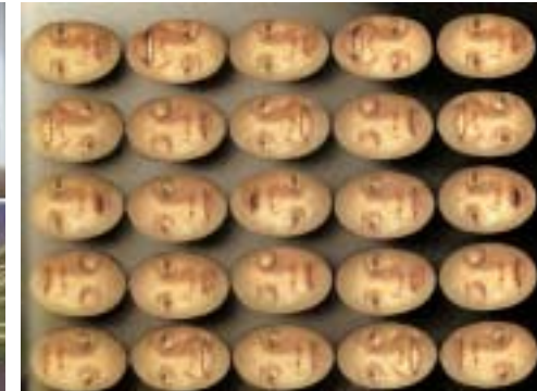
Tony Oursler - Stuck, 1996 (LCD Video-Projektion)