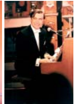
Amüsante Chansons - spottreiche Pointen

Targets (Zielscheiben) gekleidet, führen sie dem Publikum vor Augen, dass wir Menschen nicht nur zum Spielball, sondern auch zur Zielscheibe unserer eigenen Interessen werden. Ironie würzt die Darbietung beider Artisten, die durch die Kostüme wie Wesen einer anderen Art wirken. Dynamik, Perfektion und Schlagfertigkeit sind kennzeichnend für ihre Darbietung.