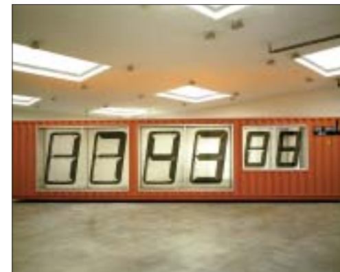
"Meantime" - Die Zeit

Die Entdeckung der Zeit in ihren verschiedenen Erinnerungsformen oder Projektionsfeldern stellt einen Schwerpunkt des jungen britischen Künstlers Darren Almond (geb. 1971) dar.