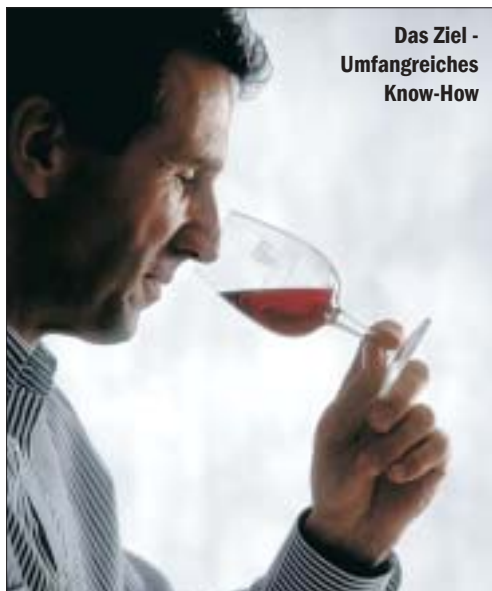
Das Ziel - Umfangreiches Know-How

Gastronomie im Rahmen eines intensiven Fort- und Weiterbildungsprogramms. Aus der Praxis für die Praxis lernen. Ziel ist es, umfangreiches Know-How und Wissen im Umgang mit Wein zu vermitteln.