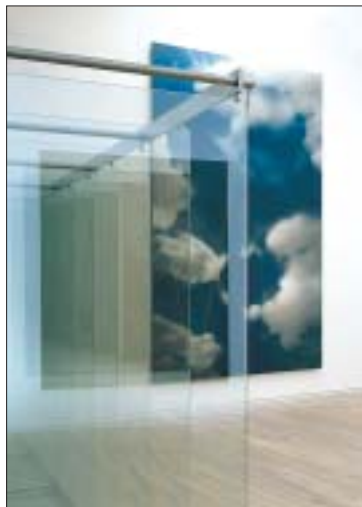
Spiegelungen - "Sieben stehende Scheiben"

Bei dieser etwa 100 Gemälde und Skulpturen umfassenden Ausstellung handelt es sich um eine Retrospektive, die alle wichtigen Etappen des Œuvres von Gerhard Richter berücksichtigt. Im Zentrum stehen Bilder nach Fotos, graue Bilder und Abstraktionen. Neue und neueste Werke, Landschaften wie auch abstrakte Kompositionen, die bisher nicht in der Öffentlichkeit zu sehen waren. Auch eine Reihe von Glasarbeiten werden zu sehen sein: Glasscheiben, Hinterglasbilder, Spiegel und Skulpturen, die aus mehreren gestaffelten Klarsichtscheiben bzw. partiell spiegelnden Elementen bestehen.