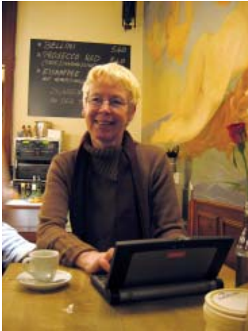
Persönliches Netzwerk - WLAN-fähiger Laptop

Eine Frau, Mitte Vierzig, sitzt in ihrem Lieblingscafe mit WLAN Hotspot in der Düsseldorfer Innenstadt. Vor ihr steht ein kleiner, eleganter schwarzer Laptop. Damit schaut sie gerade die aktuelle Ausgabe der Tagesthemen auf tagesschau.de und ruft nebenbei die neuesten e-mails ihrer Söhne mit digitalen Bildern ihres neugeborenen Enkels ab. Dazu kann sie seit dem 8. November 2004 mit einer DVB-T Karte mobil mit ihrem Laptop fernsehen.