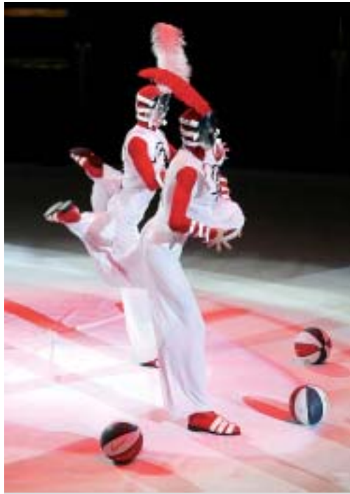
Vom Spielball zur Zielscheibe - Ironische Dynamik