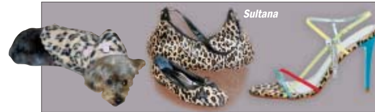
Dschungelfieber - Leoparden-Design