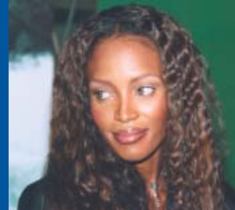
Naomi Campbell Kö-Jubiläum 2004

Wir bieten unseren Kunden: - Vermittlung von Location - Planung und Realisierung von Events - Presse- und PR-Betreuung - Catering, Entertainment und Fahrservice