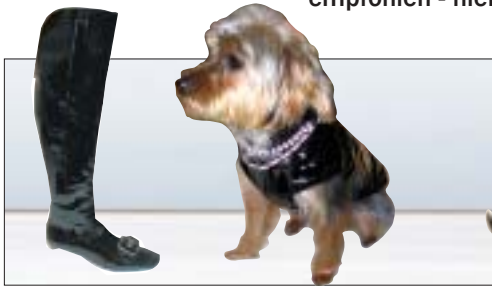
Sexy - Schwarzer Lack für Frauchen und Hund