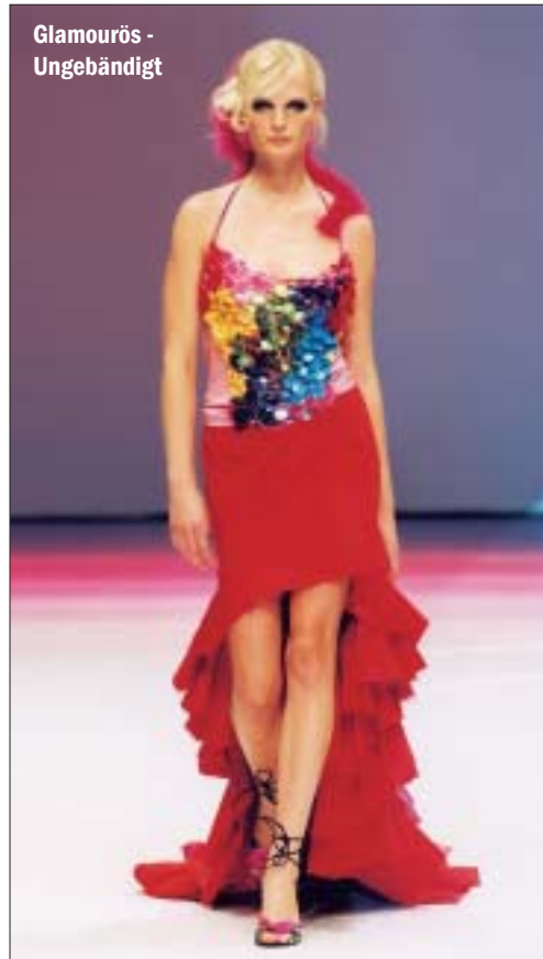
Glamourös - Ungebändigt