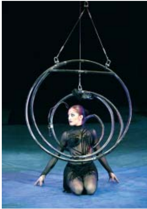
Innovativ - Anmutig leicht

Die neue Apollo-Show steht im Zeichen der Weihnachtszeit - passend dazu der Show-Name "Himmlisch". Und so soll die Weihnachtszeit im Apollo auch werden. Eine Gruppe außergewöhnlicher Künstler löst dieses Versprechen ein, die sich alle durch Originalität, Ästhetik und Perfektion auszeichnen.