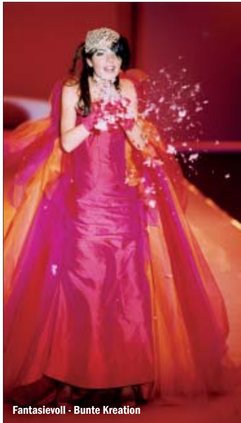
Fantasievoll - Bunte Kreation