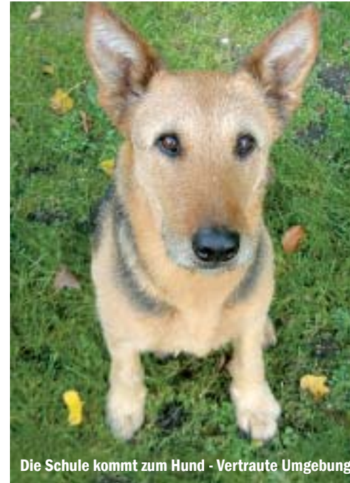
Die Schule kommt zum Hund - Vertraute Umgebung

aufgebaut, allerdings eine besondere: eine mobile. Was das bedeutet? Ganz einfach: die Schule kommt zum Hund, nicht umgekehrt. Breuers Gründe leuchten ein: "Zu einer gewöhnlichen Hundeschule fährt man hin, macht auf dem Übungsplatz seine Übungen und fährt wieder nach Hause. Oft passiert es, dass die Hunde die Übungen auf dem Platz gut bis sehr gut machen, aber in ihrer vertrauten Umgebung und vor allem dort, wo bestimmtes Verhalten erwünscht ist, z. B. beim Tierarzt, sind die erlernten Kommandos sofort vergessen." Im konzentrierten Einzelunterricht gelingt es, unerwünschte Verhaltensweisen wie etwa das Schlafen im Bett oder das Hochspringen an der Küchenzeile zu verändern oder sogar Traumata aufzulösen, wenn der Hund z.B. nach einem Unfall Panik vor dem Auto entwickelt hat oder nicht an der Leine gehen kann, weil er von einem Vorbesitzer