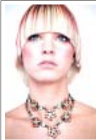
Spezialgebiet - Farben und Schnitte

"Zum Schluss möchte ich noch etwas loswerden: Ein großes Dankeschön, dass ich bei dieser Zeitschrift von Anfang an mitwirken darf. Endlich mal etwas anderes im Handtaschenformat."