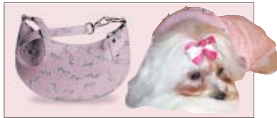
Cutsey-Bag - Zartrosa Träume à la Hollywood