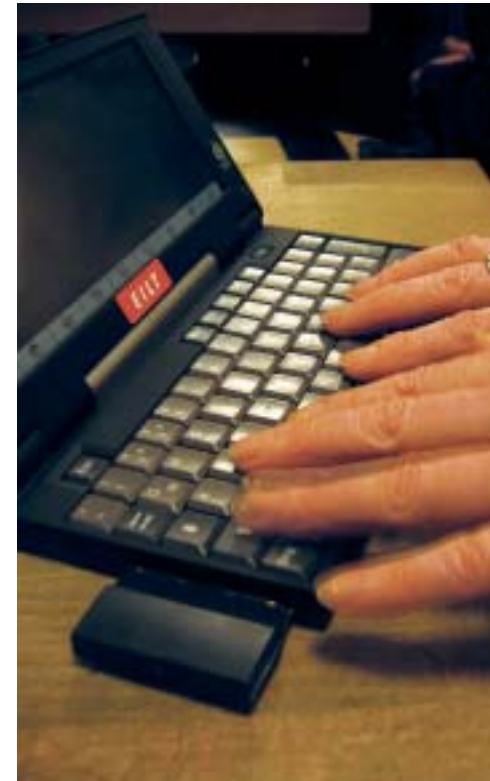
Mobil surfen - Klassisches Internet

Mit einem Endgerät der neuesten Generation mit integrierter WLAN Karte ist das genauso einfach, wie einen Fernseher einzuschalten. Sie drückt einfach den Anschaltknopf, wartet bis das Gerät hochgefahren ist, startet den Browser und loggt sich mit ihren Zugangsdaten (beispielsweise ihre Emailadresse und ihr Passwort) oder in einem für die Nutzung kostenlosen WLAN Hotspot direkt ein. Und