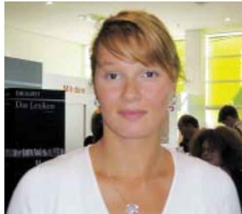
Franziska van Almsick

Mein wahres Leben Verlagsgruppe Lübbe 22,90 €