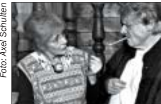
Eine Weihnachtskomödie von Stefan Vögel