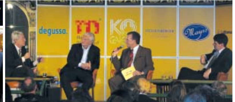
v.l.n.r. Frank Elstner, Rudi Völller, Jan Hofer und Joachim Erwin

Die internationale Künstler- und Medienagentur Paul Spiegel und die Werbebegegnungsgemeinschaft Kö-Galerie haben ein neues Event ins Leben gerufen - den Kö Talk. In der Halle des Mayr's Restaurant stellen sich jeweils drei prominente Gäste aus allen Bereichen den Fragen des Chefsprechers der ARD-Tagesschau und Moderators Jan Hofer.