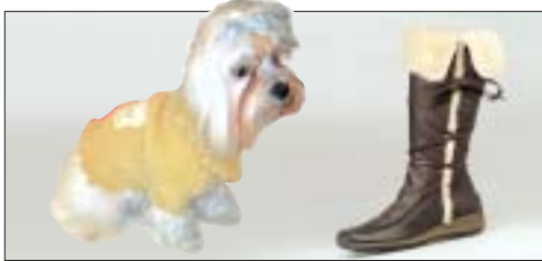
Flauschig weich - Wärmend im Winter