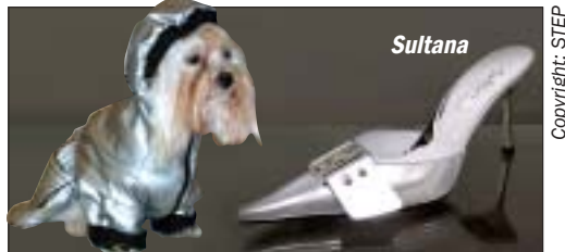
Silber - Absolut stylisch