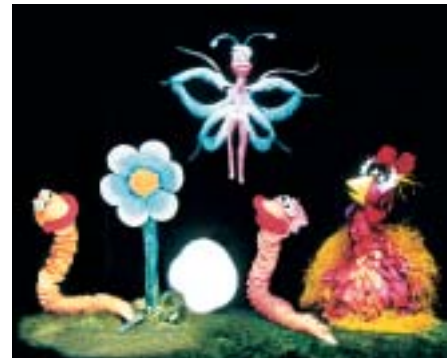
Schwarzer Humor in Farbe - Prager Publikums- liebhaber

Das Duo Target erzählt uns eine alltägliche Begebenheit in einer außergewöhnlichen Form. Als