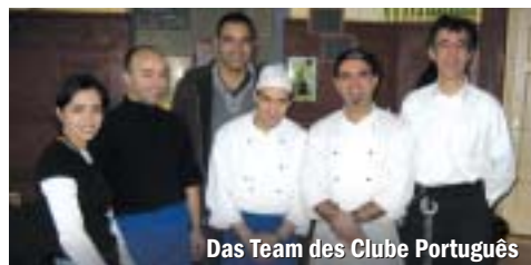
Das Team des Clube Português

Wer über die Schwelle des Clube Português tritt, wird augenblicklich von dem typisch portugiesischen Charme in Empfang genommen. Schwere Holztische, wuchtige Kerzenleuchter und das südländisch stilvolle Ambiente wecken sonnige Urlaubsgefühle.