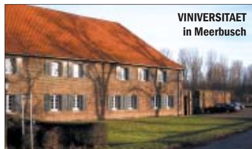
VINIVERSITAET in Meerbusch

Die Referenten der VINIVERSITAET sind ausgewiesene Weinfachleute. Trocken und akademisch geht es bei der VINIVERSITAET trotzdem nicht zu: das garantiert der Wein im Glas! Informationen zum Programm der VINIVERSITAET finden sich im Internet unter www.viniversitaet.de