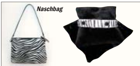
Der Zebra-Look - Passend zum Halsband