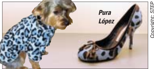
Safari-Look der Extraklasse - Eine starke Mischung