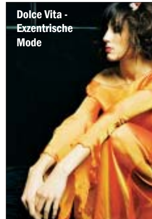
Dolce Vita - Exzentrische Mode